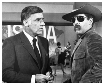
1968 CRAMPONNE-TOI JERRY (Hook, line and sniker) de George Marshall avec Jerry Lewis