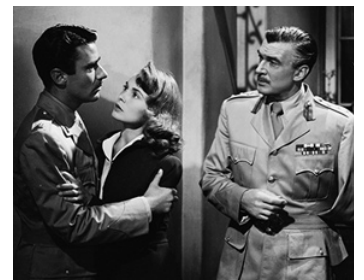
1949 LE DANUBE ROUGE (The red Danube) de G. Sidney avec Janet Leigh, Walter Pidgeon