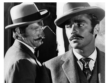
1952 LA LOI DU FOUËT (Kangaroo) de Lewis Milestone avec Richard Boone