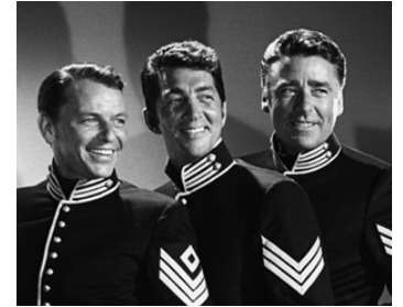
1961 LES TROIS SERGENTS (Sergeants three) de John Sturges avec F. Sinatra, Dean Martin