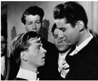
1938 BARREAUX BLANCS (Lord Jeff) de Sam Wood avec Mickey Rooney