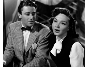
1947 TOUT LE MONDE CHANTE (It happened in Brooklyn) de R. Whorf avec Kathryn Grayson