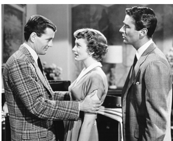
1950 J'AI TROIS AMOURS (Please believe me) de N. Taurog avec Robert Walker, Deborah Kerr