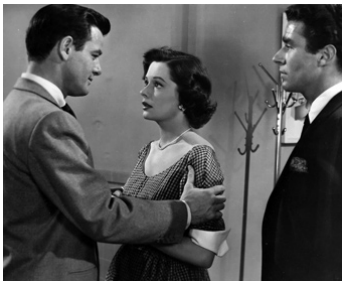
1952 TOI POUR MOI (You for me) de Don Weis avec Gig Young, Jane Greer