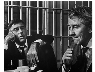
1968 SKIDOO (Skidoo) d'Otto Preminger avec Burgess Meredith