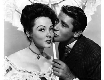
1946 DU BURLESQUE À L'OPÉRA (Two Sisters from Boston) d'Henry Koster avec Kathryn Grayson