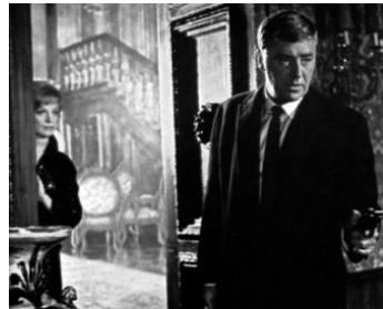
1967 DEUX BILLETS POUR MEXICO de Christian-Jaque avec Ira Furstenberg