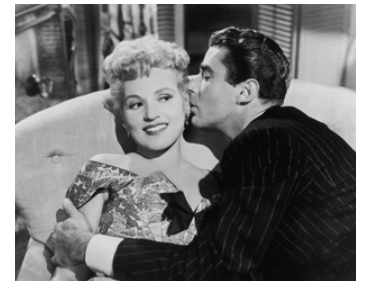
1954 UNE FEMME QUI S'AFFICHE (It should happen to you) de George Cukor avec Judy Holliday