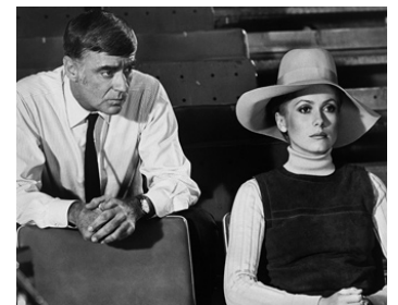
1969 FOLIES D'AVRIL (The April Fools) de Stuart Rosenberg avec Catherine Deneuve