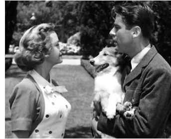
1945 LE FILS DE LASSIE (Son of Lassie) de S. Sylvan Simon avec June Lockhart