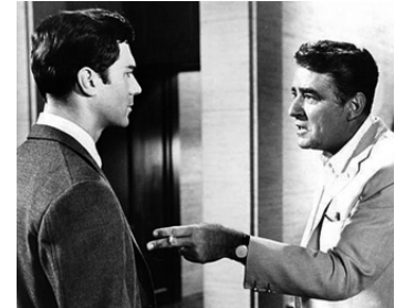
1964 L'ENQUÊTE (Sylvia) de Gordon Douglas avec George Maharis