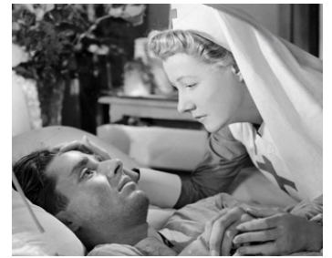
1944 LES BLANCHES FALAISES DE DOUVRES (The white cliffs of Dover) de C. Brown avec Irene Dunne