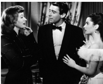
1948 LA BELLE IMPRUDENTE (Julia Misbehaves) de Jack Conway avec Greer Garson, E. Taylor