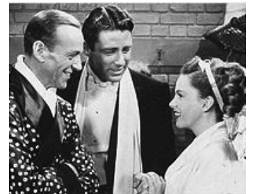
1948 PARADE DE PRINTEMPS (Easter Parade) de Ch. Walters avec Fred Astaire, Judy Garland