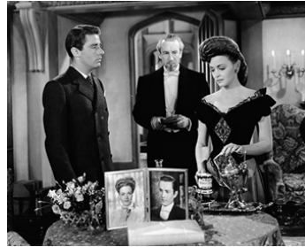
1945 LE PORTRAIT DE DORIAN GRAY (The Picture of D. Gray) d'A. Lewin avec G. Sanders, Donna Reed