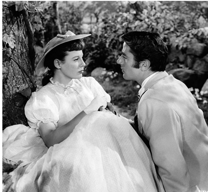
1948 LES QUATRE FILLES DU DOCTEUR MARCH (Little Women) de Mervyn LeRoy avec June Allyson