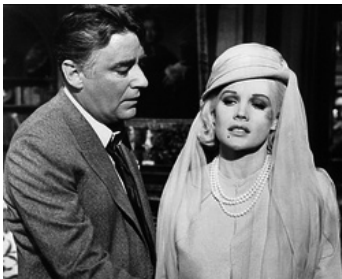
1965 HARLOW, LA BLONDE PLATINE (Harlow) de Gordon Douglas avec Carroll Baker