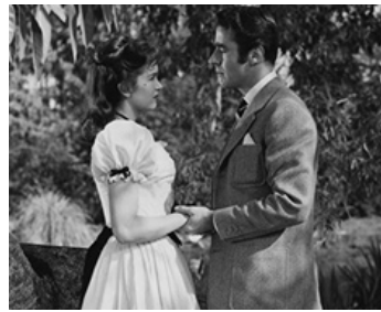
1952 LA TREIZIÈME HEURE (The Hour of thirteen) de Harold French avec Dawn Addams