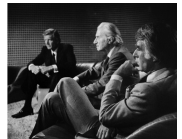
1974 ROSEBUD (Rosebud) d'Otto Preminger avec John Lindsay, Claude Dauphin