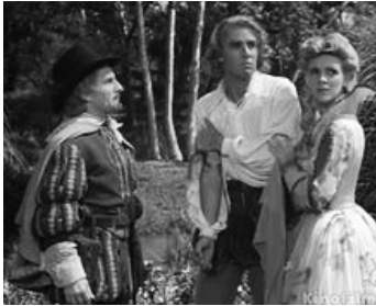
1944 THE CANTERVILLE GHOST de Jules Dassin avec Reginald Owen, Frances Raeburn