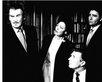
1962 TEMPÊTE SUR WASHINGTON (Advise and consent) d'O. Preminger avec W. Pidgeon, G. Tierney