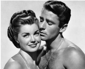
1947 DANS UNE ÎLE AVEC VOUS (On an Island with you) de R. Thorpe avec Esther Williams