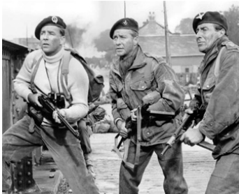
1962 LE JOUR LE PLUS LONG (The longest Day) de Ken Annakin avec Richard Todd