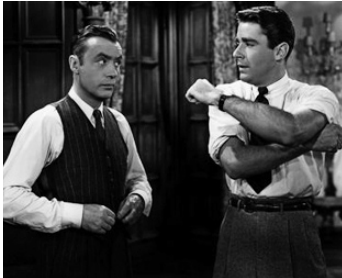
1946 LA FOLLE INGÉNUË (Cluny Brown) d'Ernst Lubitsch avec Charles Boyer