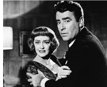
1963 LA MORT FRAPPE TROIS FOIS (Dead Ringer) de Paul Henreid avec Bette Davis