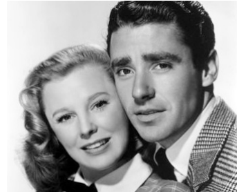
1947 VIVE L'AMOUR ! (Good News) de Charles Walters avec June Allyson