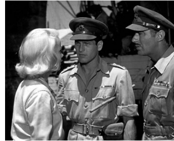
1960 EXODUS (Exodus) d'Otto Preminger avec Eva-Marie Saint, Paul Newman