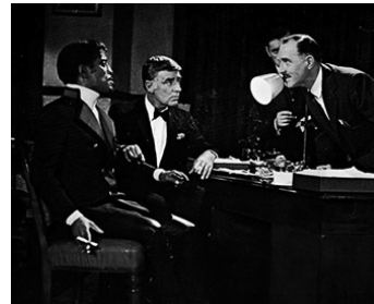
1967 SEL, POIVRE ET DYNAMITE (Salt and Pepper) de Richard Donner avec Sammy Davis Jr