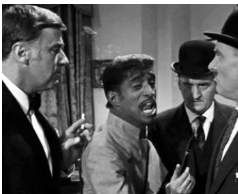
1969 UNE FOIS DE PLUS (One more time) de Jerry Lewis avec Sammy Davis Jr