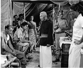
1959 LA PROIE DES VAUTOURS (Never so few) de J. Sturges avec F. Sinatra, Ch. Bronson, S. McQueen