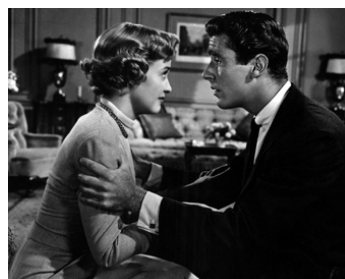
1950 MARIAGE ROYAL (Royal Wedding) de Stanley Donen avec Jane Powell