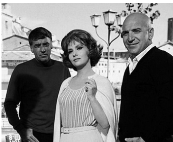
1968 BUENA SERA, MRS CAMPBELL de Melvyn Frank avec Gina Lollobrigida, Telly Savalas