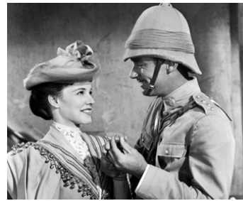
1952 ON SE BAT AUX INDES (Rogue's March) d'Allan Davis avec Janice Rule