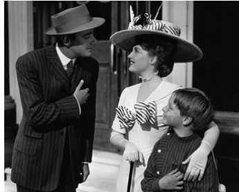
1946 MY BROTHER TALKS TO HORSES de Fred Zinnemann avec Beverly Tyler, Butch Jenkins