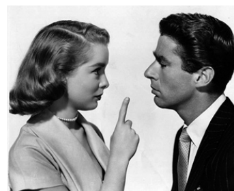
1951 UNE FOIS N'ENGAGE À RIEN (Just this Once) de Don Weis avec Janet Leigh