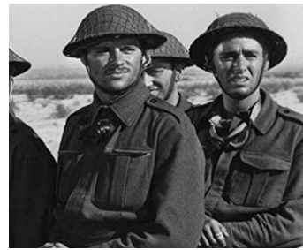
1942 AVENTURE EN LYBIE (Immortal Sergeant) de John M. Stahl avec Reginald Gardiner