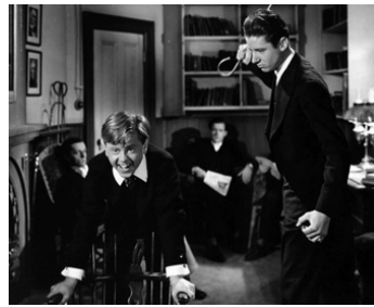
1942 UN DRÔLE DE LASCAR (A Yank at Eton) de Norman Taurog avec Mickey Rooney